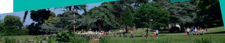
Parc du Port Breton

La Malouine est un lotissement balnéaire de luxe construit à la fin du XIX e s. sur un site de promontoire et constitue la vitrine de la station.