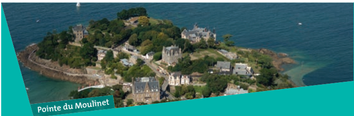
Pointe du Moulinet