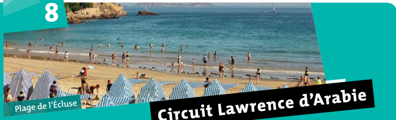
Plage de l'Écluse