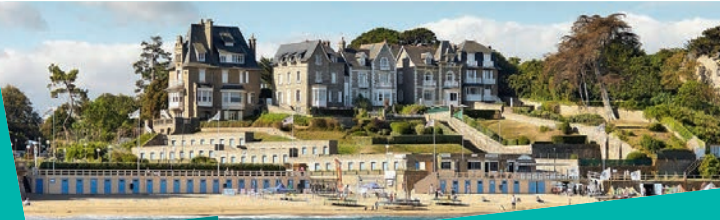
Plage de Saint-Enogat