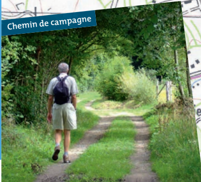
Chemin de campagne