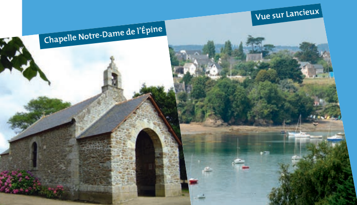
Chapelle Notre-Dame de l'Épine

On observe deux anciens moulins à vent privés sur le circuit: le moulin de Bellevue sur le grand circuit et le moulin de La Marche sur le petit circuit.