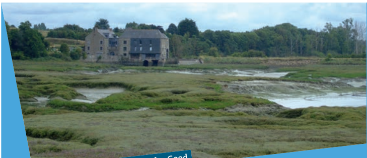
Ancien moulin à marée de Roche-Good